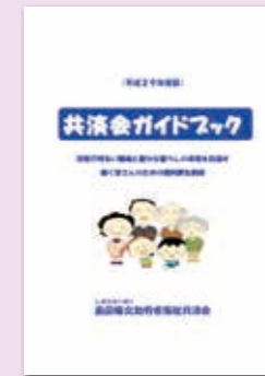
共済会ガイドブック