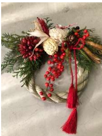
《当日の作品イメージ》